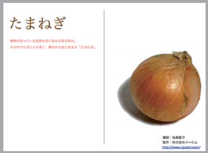
【記事 No. cr-dy-0012】

春が旬の“たまねぎ”たくさん収穫したら、保存性を高めるため干して表皮を乾燥させます。琥珀のような色になったら、その皮から色を煮出して染色ができます。今春収穫したたまねぎならば梅雨明けあたりが、たまねぎ染色のチャンスです。ミニナルアートの工作人気コンテンツからの抜粋です。ぜひ、お試しください。